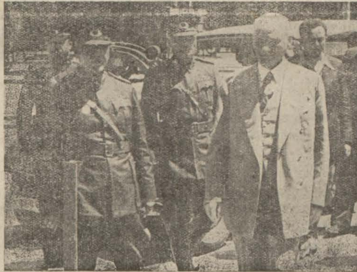
Atatürk Mersinde kumandanlarımızla bir arada